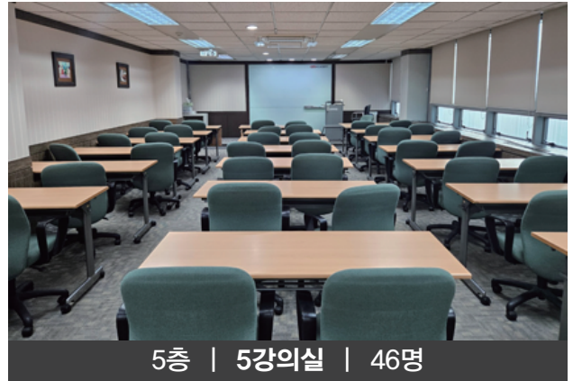
5층 | 5강의실 | 46명