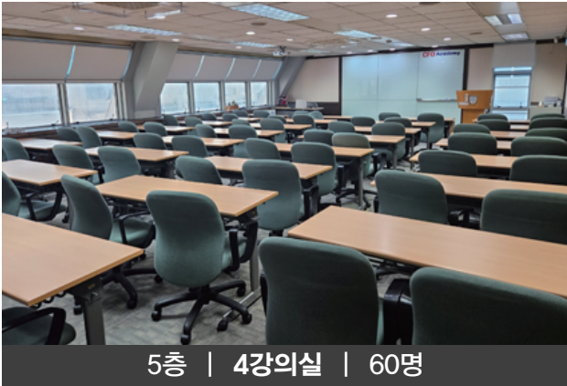
5층 | 4강의실 | 60명