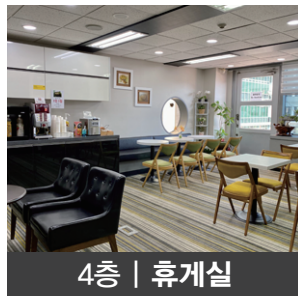
4층 | 휴게실