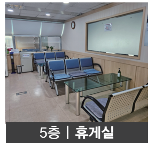
5층 | 휴게실