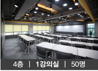
4층 | 1강의실 | 50명