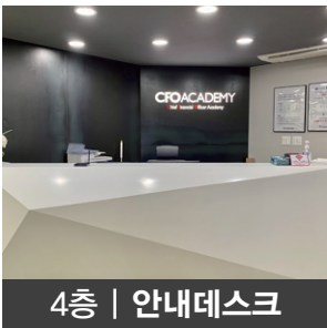
4층 | 안내데스크