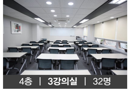
4층 | 3강의실 | 32명