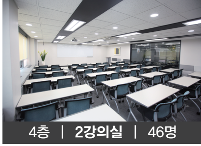
4층 | 2강의실 | 46명