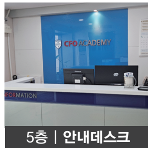
5층 | 안내데스크